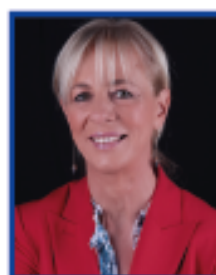
Dottorssa Elisabetta Buscarini - Presidente di FISMAD (Federazione Italiana Società Malattia Apparato Digerente) Direttore, UOC Gastroenterologia ed Endoscopia Digestiva Ospedale Maggiore di Crema

La campagna Fismad per la prevenzione del cancro coloretale prosegue nonostante il Covid-19. L'arma per combattere questa terribile malattia è lo screening