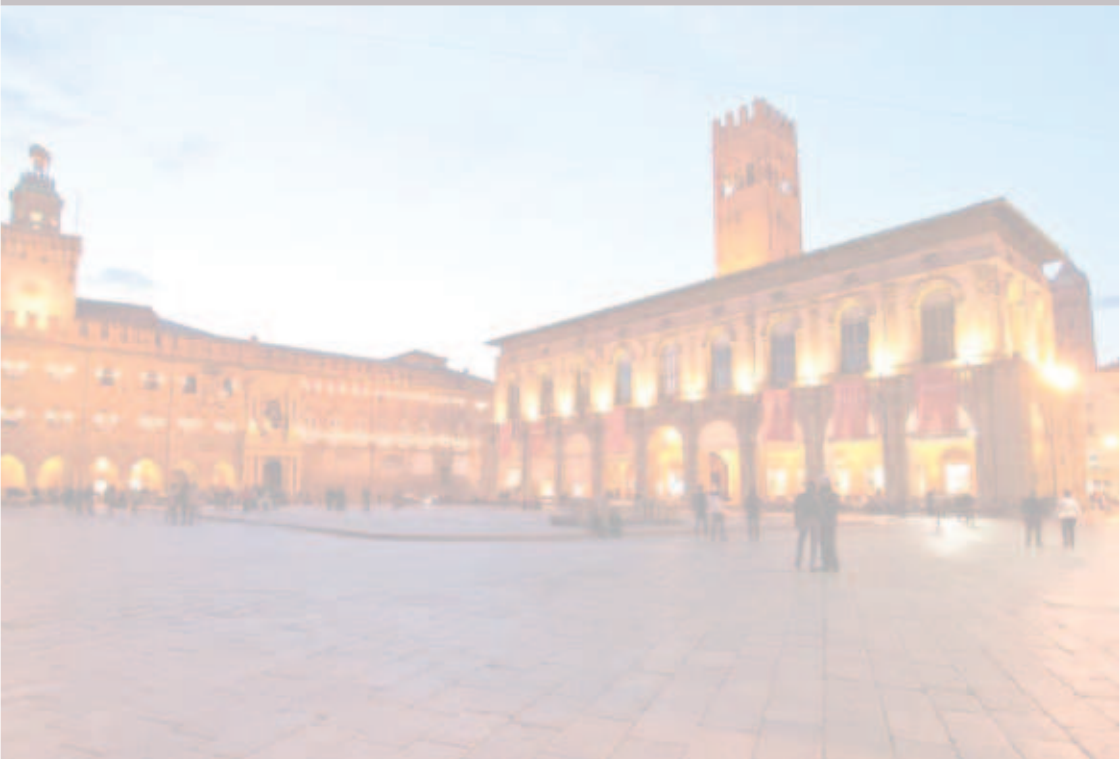
Piazza Grande - Bologna