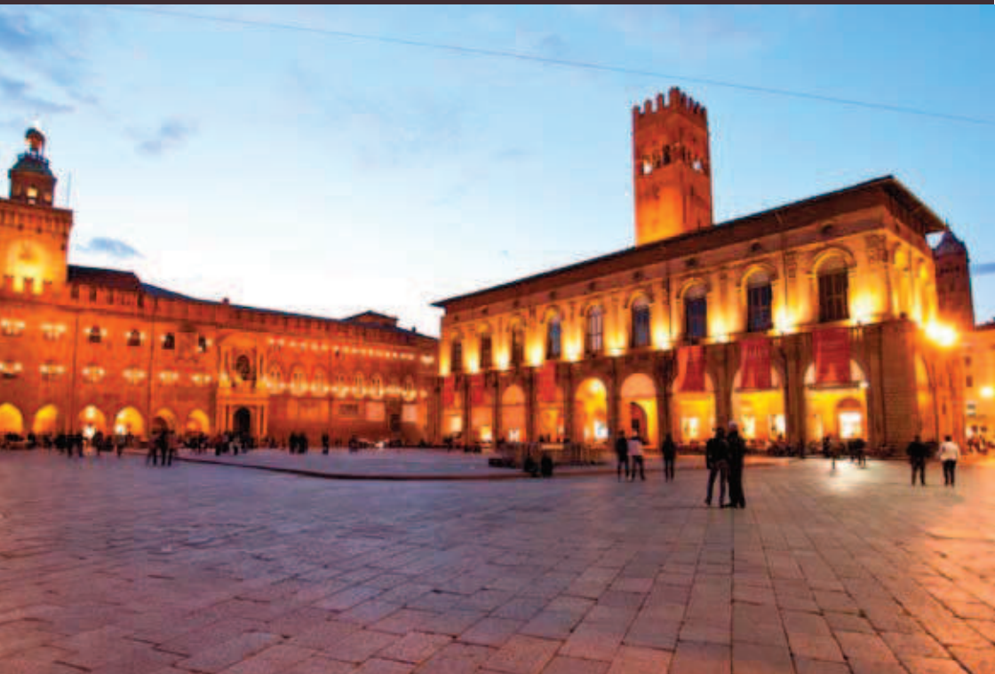
Piazza Grande - Bologna